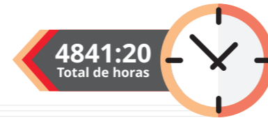
Horas DSS - 2023

TREINAMENTOS E CONSCIENTIZAÇÃO DE SEGURANÇA DO TRABALHO (DSS + CULTURA ORGANIZACIONAL + QUALIDADE AMBIENTAL)