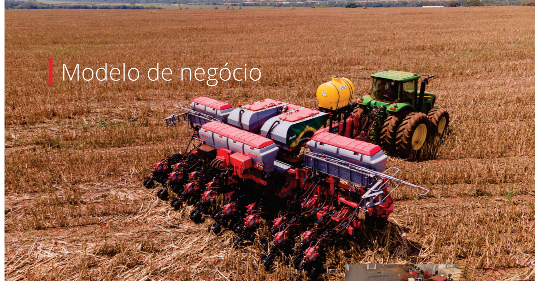
Foto do modelo T320 plantando sobre palhada densa

Nosso negócio é aumentar a produtividade do Agronegócio, materializado pelo desenvolvimento, fabricação e comercialização de implementos agrícolas para o plantio das culturas de verão, inverno e hortaliças. A comercialização dos nossos produtos e serviços é feita majoritariamente via canais de vendas parceiros não exclusivos da marca, mas também pontualmente, via direta ao cliente final, com comissionamento para os canais de vendas. A inovação é um dos nossos pilares estratégicos; os projetos são executados pela área de P&D interna e, também, por meio de parcerias de inovação