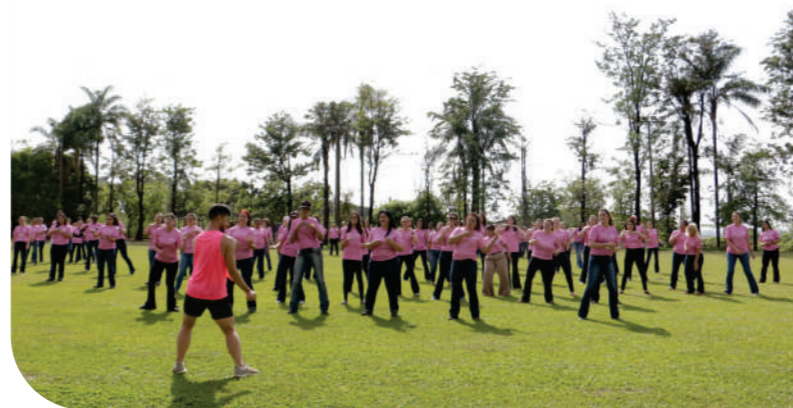
Outubro Rosa – atividades ao ar livre.

A JUMIL, sempre buscando interagir com a comunidade, coloca em prática diversas campanhas de saúde, como: