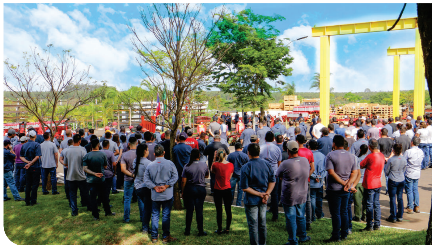
Ao longo de 2023, os colaboradores foram reunidos mensalmente, com o intuito de promover a Missão, a Visão e os Valores da empresa, proporcionando uma vivência constante, para que as ações de cada um estejam alinhadas aos propósitos da JUMIL.