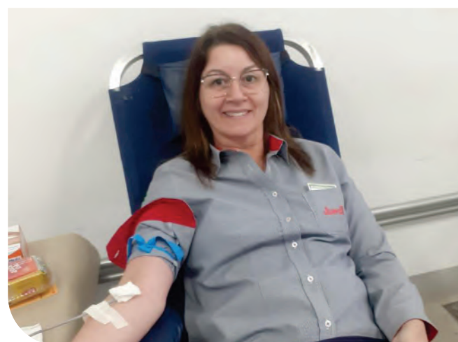
Campanha interna de doação de sangue

A JUMIL sabe que o ato de doar sangue impactará positivamente a vida de muitas pessoas necessitadas; por isso, realizamos uma ação de doação voluntária, em parceria com o Hemocentro de Ribeirão Preto. No total, foram coletadas 89 bolsas de sangue, além da captação de três medulas ósseas.