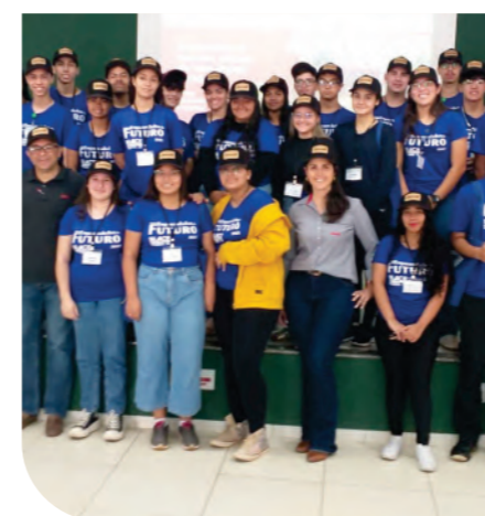
Programa Jovem Empreendedor do Futuro

O evento reuniu cerca de 120 fornecedores de itens produtivos, e os destaques foram premiados pelo engajamento e atingimento das metas de qualidade.