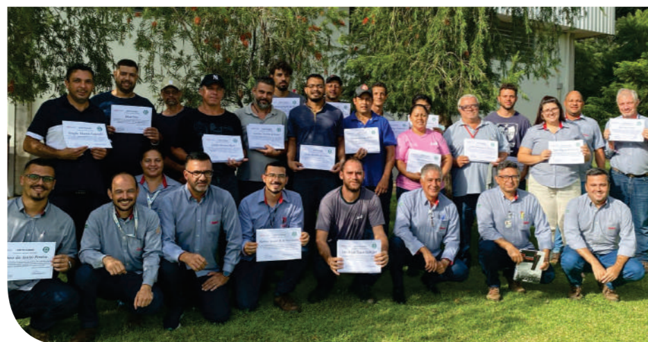
Colaboradores da Comissão Interna de Prevenção de Acidentes e Assédio (CIPA)