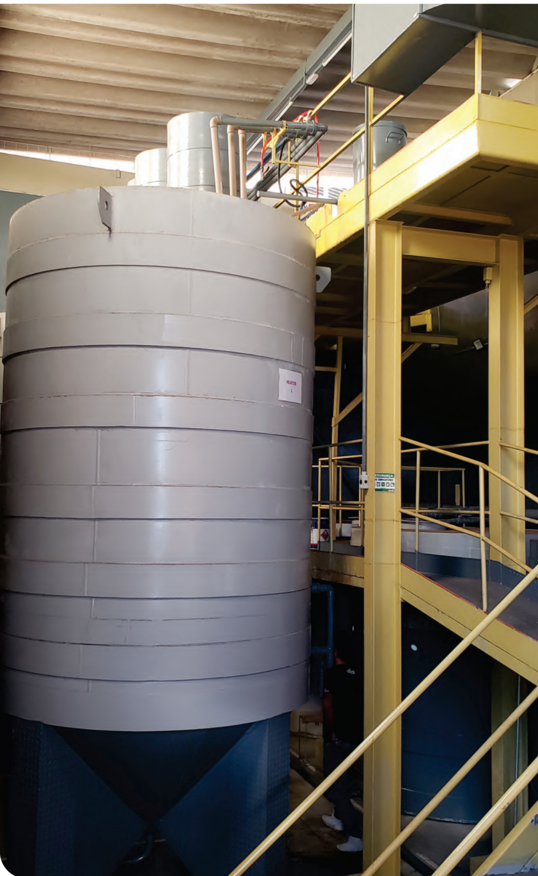
Tanque de tratamento de água