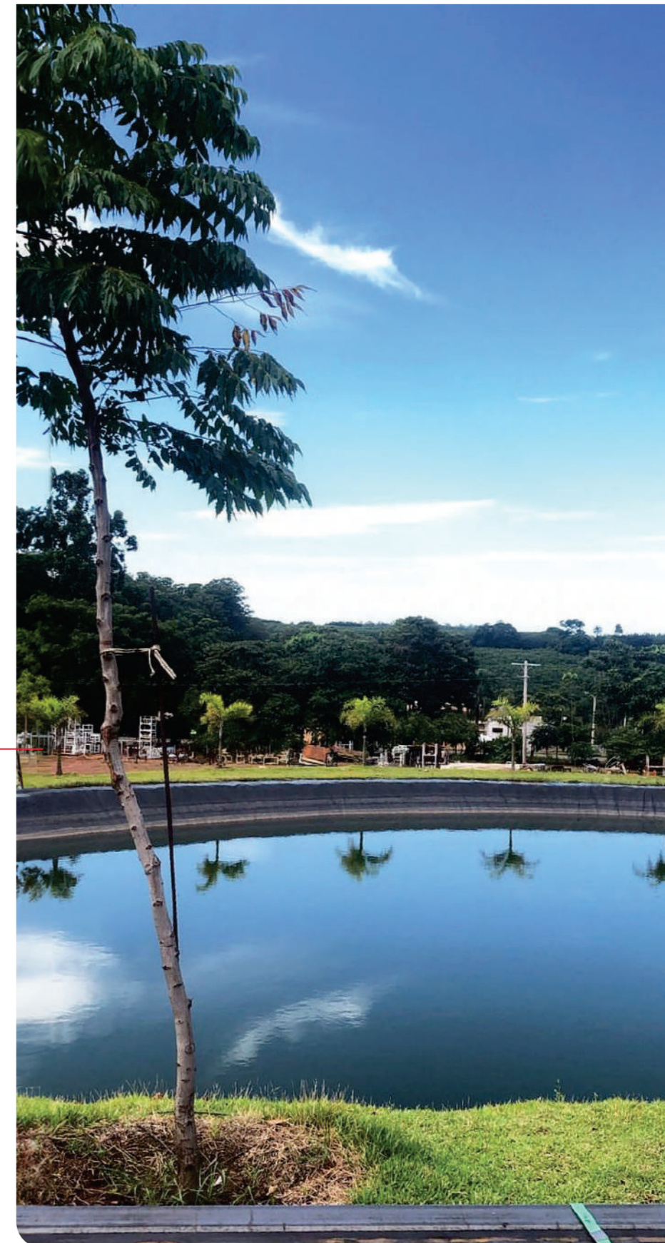
Represa JUMIL para reuso da água pluvial

Adotamos o aproveitamento da água pluvial, possibilitando seu reuso para fins não potáveis, gerando um ganho social e ambiental. O projeto apresenta o dimensionamento de um sistema com calhas, tubulações e reservatórios, capaz de coletar a água que cai sobre o telhado (aproximadamente 27 mil m 2 ) e pátios (aproximadamente 30 mil m 2 ) para conduzi-la ao seu armazenamento de cerca de cinco milhões de litros.