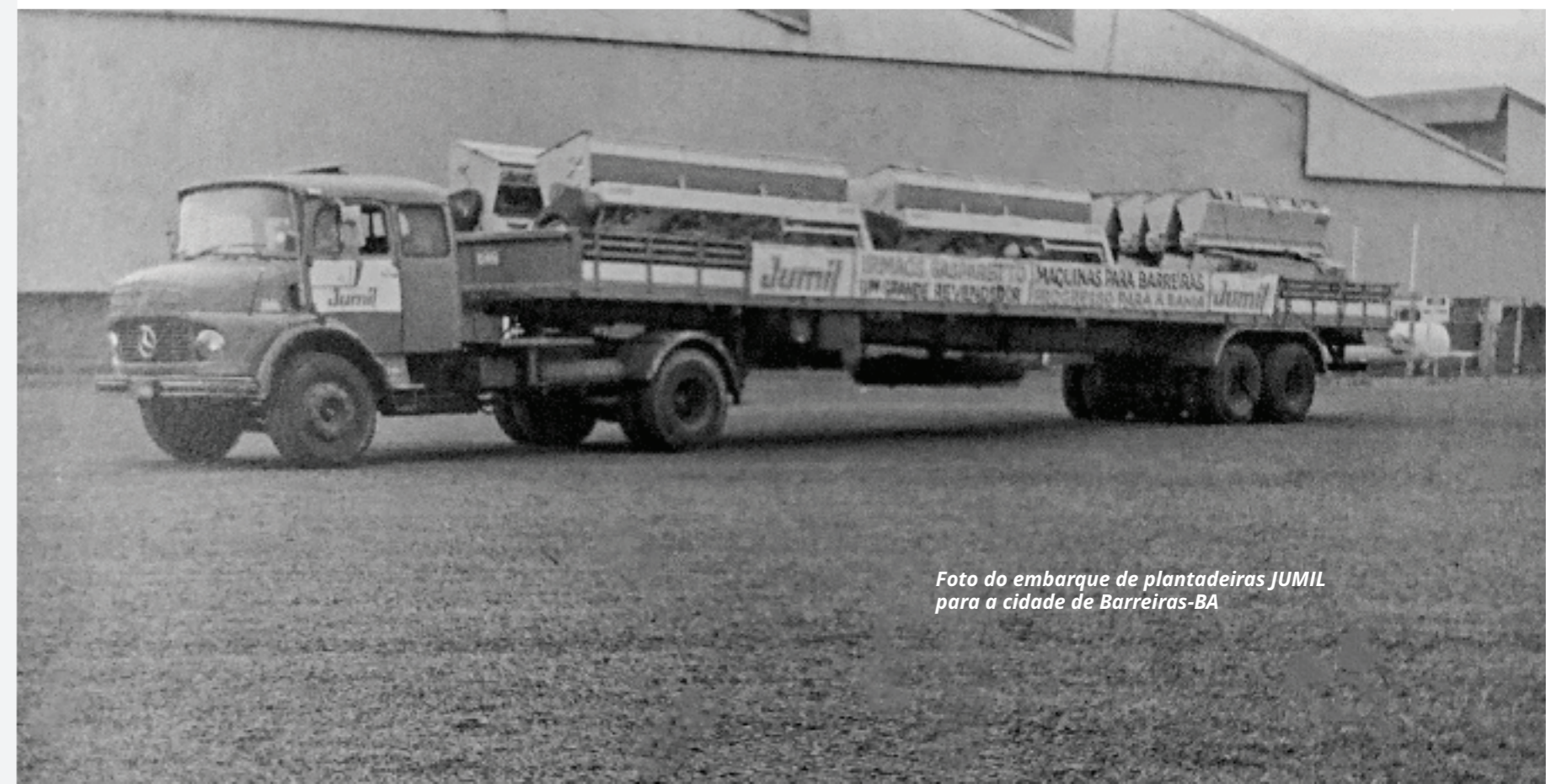
Foto do embarque de plantadeiras JUMIL para a cidade de Barreiras-BA