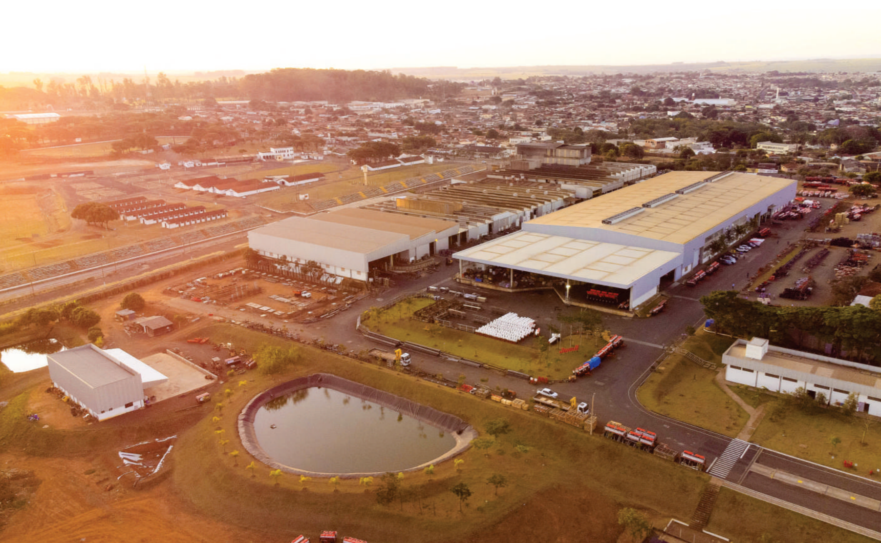
Unidade fabril sediada em Batatais, interior de São Paulo