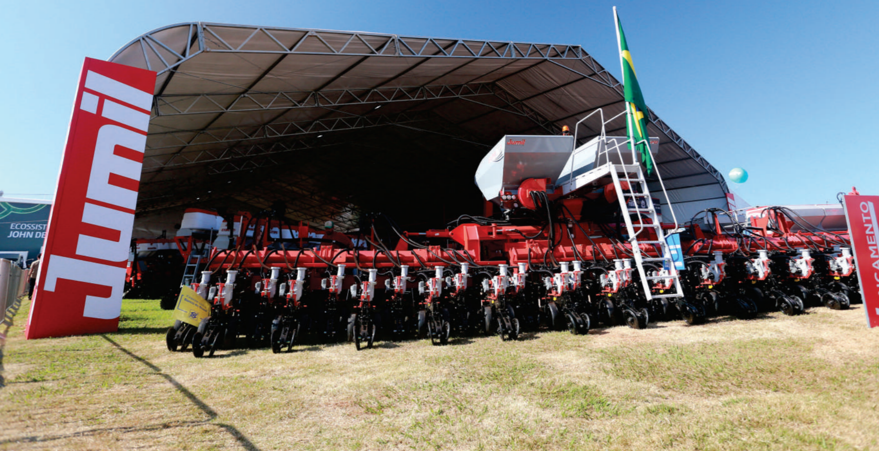
Feira Agrishow 2022, em Ribeirão Preto-SP

A trajetória de crescimento da JUMIL, desde a sua fundação, sempre foi marcada pela constante busca por inovação e um compromisso contínuo com as melhores práticas, mantendo foco incessante na otimização da produtividade em cada etapa da evolução da agricultura.